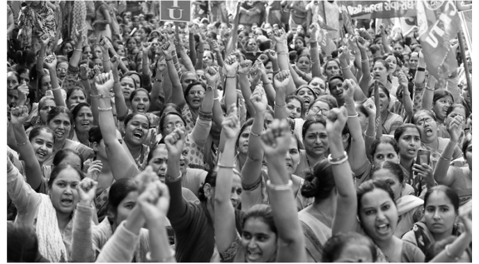
Generalstreik am 8. Januar

A m 8. Januar legten in Indien etwa 250 Millionen Menschen für 24 Stunden ihre Arbeit nieder. Mit diesem Generalstreik demonstrierten die Menschen gegen die Wirtschaftspolitik des Premierministers Narendra Modi, forderten höhere Löhne, ein Ende von kurzzeitig befristeten Arbeitsverträgen und ein Ende von Privatisierungen. Durch das Zusammenschließen von 10 verschiedenen Gewerkschaften wurde der Streik der größte Generalstreik der Welt, der jemals organisiert wurde. Gleichzeitig finden weiterhin in ganz Indien Proteste gegen das neue Staatsbürgerschaftsänderungsgesetz statt. Dieses Gesetz wurde im Dezember eingeführt und macht es Menschen aus Pakistan, Afghanistan und Bangladesch leichter, die indische Staatsangehörigkeit zu beantragen – allerdings gilt das Gesetz nur für bestimmte Religionsangehörige und nicht für Muslime. Zunächst konzentrierten sich die Proteste